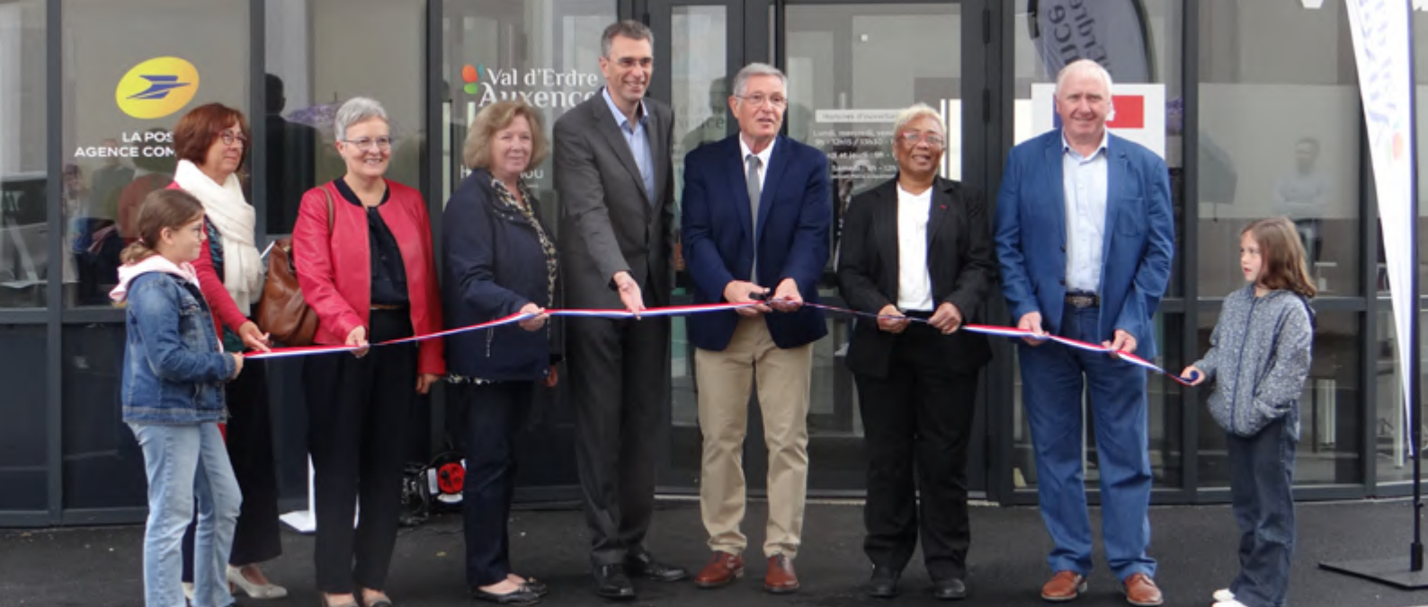
L'espace France Services Val d'Erdre-Auxence a été officiellement inauguré le samedi 25 juin 2022 sur la commune déléguée du Louroux-Béconnais.