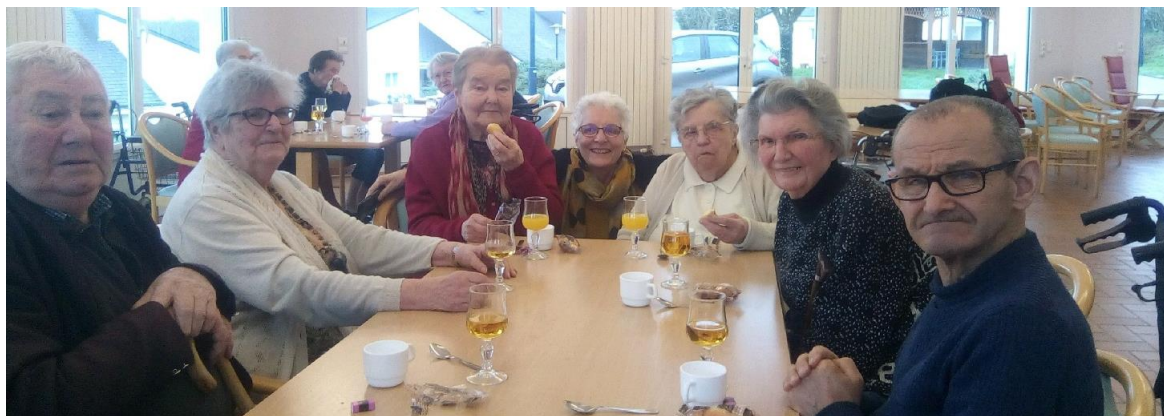
14 janvier 2020 : sortie au Louroux-Béconnais pour un après-midi chansons