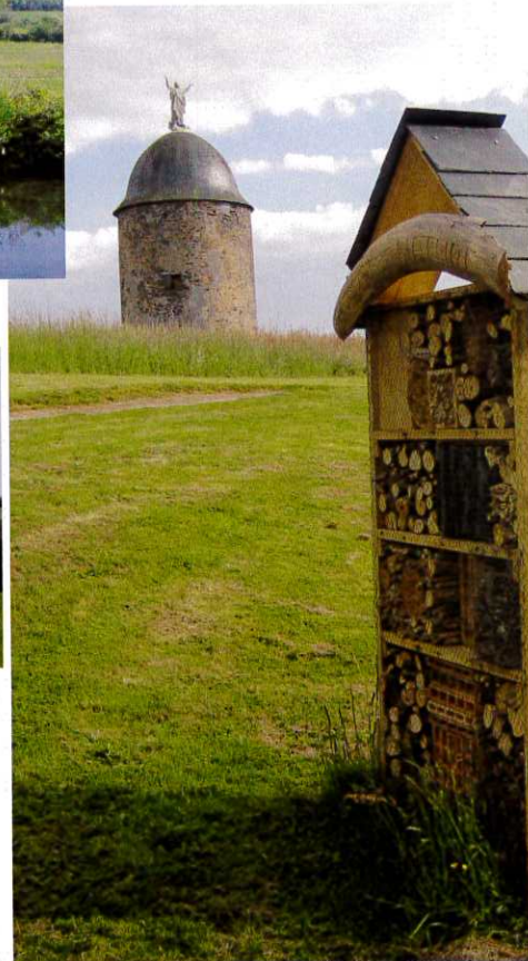
le Moulin de la Vierge