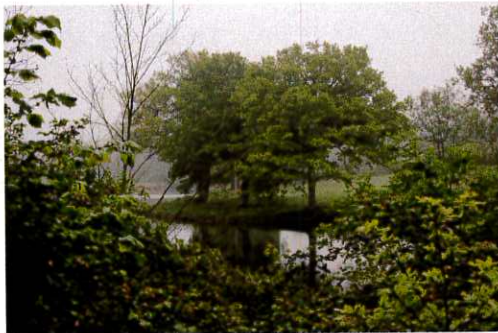
Etang du Moulin