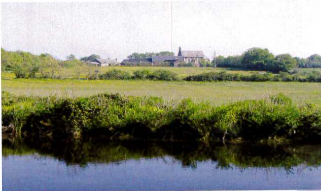
la Commanderie :