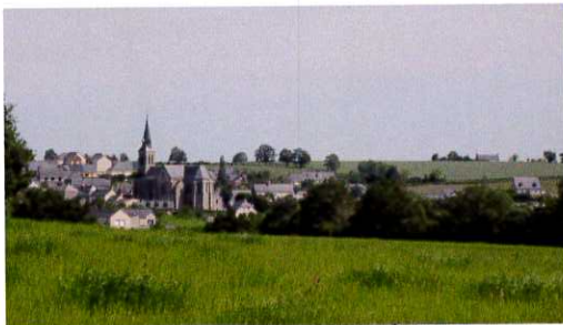
vue du Bourg