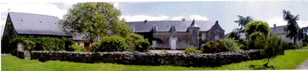
le Prieuré : photo Alain Pellerin