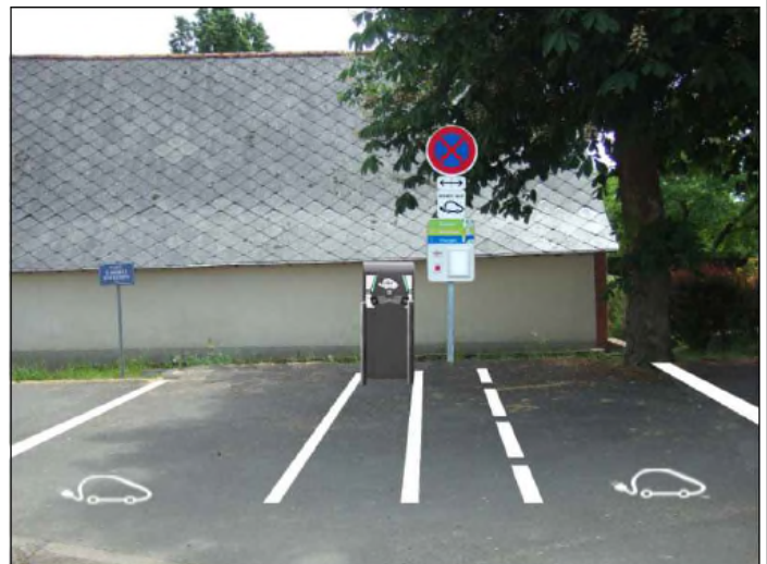
Emplacement prévisionnel de la borne IRVE

Les travaux sont prévus mi-septembre pour une durée de 3 mois. Pas d'interdiction de circuler, travaux avec des feux qui feront alterner la circulation.