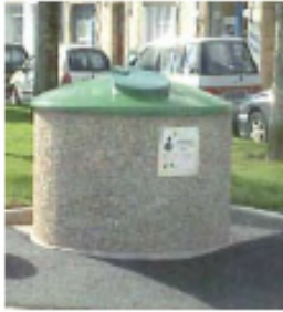
Photo (finition différente)